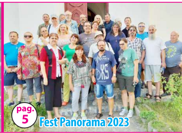
pag. 5 Fest Panorama 2023