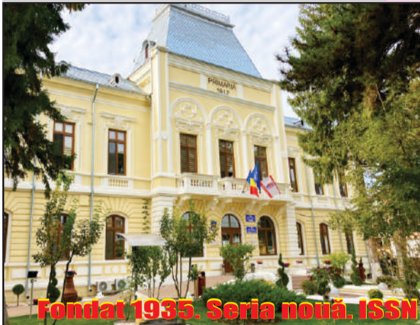
Fondat 1935. Seria nouă. ISSN 1454 - 198X