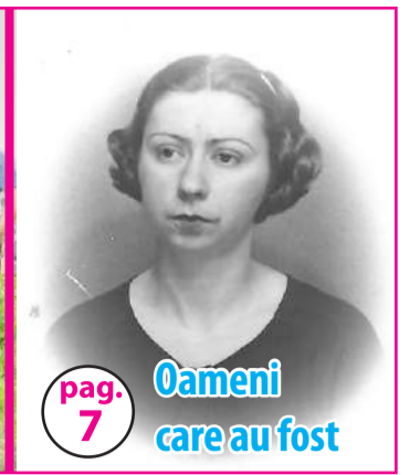
pag. 7 Oameni care au fost