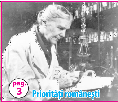
pag. 3 Priorități românești