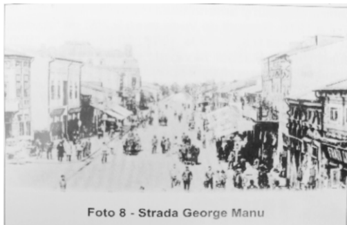
Foto 8 - Strada George Manu

Purtându-și destinul prin coclaurii lumii, fiecare, pe unde se vântură, seamănă măcar o sământă din